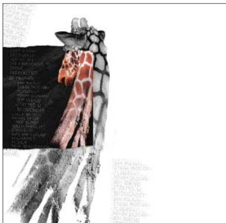
» Transformation «, psihofotografika, 2001

je ponovo pokrenuo pesničko nadahnuće koje je omogućilo nastanak prve zbirke » Trans-formation «, 2002. Kako prvu tako i drugu zbirku pesama je izdala agencija Informa Echo uz podršku Ministarstva za kulturu Republike Slovenije i Društva Srpska zajednica. Pesme su napisane na srpskom jeziku i prevedene su na slovenački, engleski i nemački. Prvu knjigu su neke firme iz Slovenije i Austrije, kao ekskluzivan i zanimljiv Božićno-novogodišnji poklon, slale svojim poslovnim partnerima po Evropi.