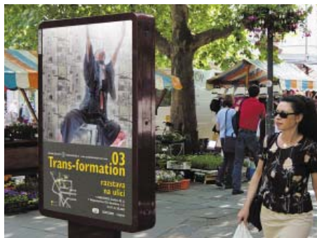
»Izložba na ulici«, 2003

»Deca žive i razmišljaju impulsivno. Kod njih još nije razvijen osećaj odgovornosti. Kod mnogih se taj osećaj ne razvije ni u zrelijoj fazi. Takvi ljudi ne preuzimaju odgovornost za svoje postupke i uzroke za neuspeh traže u drugima i u situacijama. Na taj način teško dolaze do osećanja ljubavi, pošto ljubav možeš da primaš i daješ, jedino ako je prihvatiš odgovorno. Tek kada preuzmemo odgovornost za sebe možemo da doživimo dublji odnos sa partnerom, porodicom, i ljudima sa kojima saradujemo, radimo i stvaramo.«