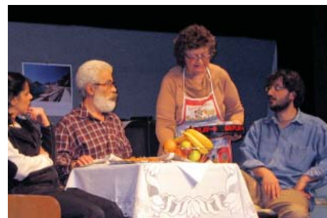
Predstava „ Naslednik “, Ljubljana, 2005

dovoljstvo, za svoju nervozu, za sve što mi se, neželjeno, dešava ali i za sve ono što bih ja želeo da se desi a ne dešava se! Jednoga dana sam, posle razgovora sa sestrom, odlučio da nešto promenim. I od tada, kada sam počeo da postavljam prioritete, preuzimam inicijative i donosim odluke – most koji me povezuje sa ljudima je postao jači i širi.«