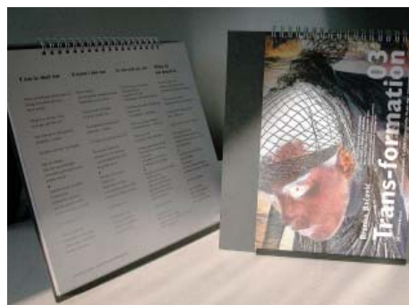
Nagrađena samostojeća knjiga » Trans-formation 03 «, 2003

U knjizi su objavljene i pesme američkog pesnika Dejvida Holera (David Holler). Svoj doživljaj zbirke » Trans-formation «, je američki filozof, profesor Noam Čomski (Noam Chomsky) izrazio rečima: „Ja sam potpuno zadivljen. To je stvarno predivna kolekcija“. („I am completely overwhelmed. It is really a delightful collection“.) Druga knjiga » Trans-formation 03 «, za koju je dobio nagradu za primenjeni dizajn na festivalu „Ideja“ u Novom Sadu, je izašla 2003 godine. Nedavno je u okviru izdavačke kuće Goga iz Novog mesta u saradnji sa Informa Echo, i uz potporu Ministarstva za kulturu Republike Slovenije i Društva Srpska zajednica, izašla i njegova treća četvorjezična zbirka pesama » Erotic Transformation «. Ovoga puta su pesme umesto na nemački kao četvrti jezik, prevedene na holandski.